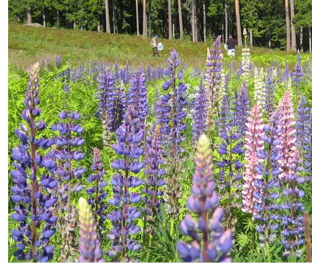
Lupiner.