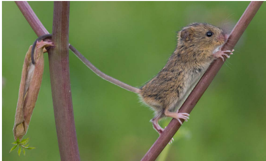
Buskmusen är en skicklig klättrare.