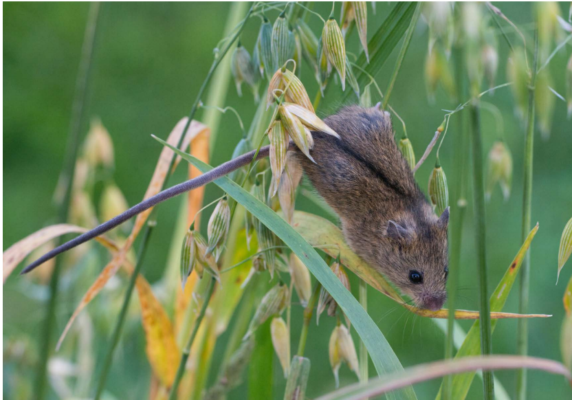
Buskmusen har en mycket lång svans och svart strimma på ryggen.

Buskmusens utseende skiljer sig tydligt från andra små gnagare som förekommer i Sverige. Den tydligt begränsade svarta ryggstrimman sträcker sig från svansen till området mellan öronen och är karakteristisk bara för buskmusen. Kroppens längd är 5–7 cm medan svansen är betydligt längre (50% längre än kroppen).